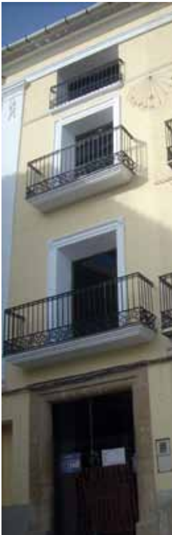
Fachada ya restaurada del actual edificio de Pensionistas y Jubilados.