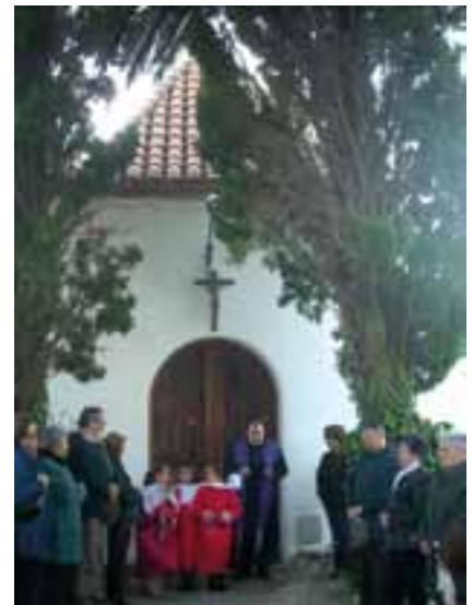
Rosario en procesión a su llegada al Cementerio municipal.

Hacia muchos años que no se celebraba este ritual católico en nuestra localidad. El día 1 de noviembre los vecinos pudieron asistir al Santo rosario en procesión (desde la Iglesia al cementerio) y, al día siguiente, festividad de todos los Santos, misa de difuntos en la propia capilla del cementerio. Los actos, presididos por mosén Joan Guerola, contaron con la presencia de innumerables feligreses.