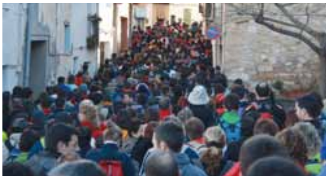
Parte de los 920 participantes desfilando por la C/ Planet. ¡Todo un record!

El 30 y 31 de octubre organizó esta asociación una estupenda salida excursionista con objeto de recorrer, unos a pie y otros con bicicleta, parte de la Vía Verde de Ojos Negros, una ruta senderista que aprovecha el recorrido del antiguo ferrocarril minero que partía desde Ojos Negros, en la provincia de Teruel, hasta el Puerto de Sagunto, cerca ya de Valencia. El itinerario, la mayor parte cuesta abajo, consta de vistas y espacios de gran belleza, múltiples