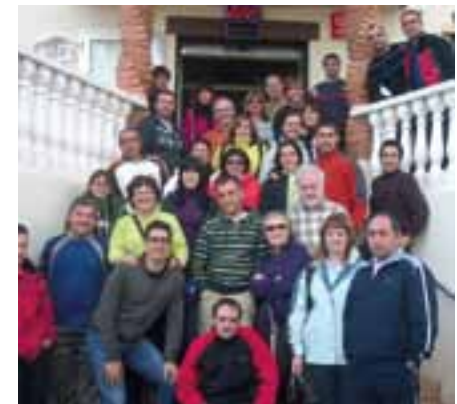
Participantes en la marcha senderista de Ojos Negros

MARXA SENDERISTA de Cervera, con un recorrido de 23 kilómetros y una participación record hasta la fecha: 920 inscritos (frente a los 143 de la primera edición en 2004). Todos los participantes, además de disfrutar de las excelentes panorámicas e inigualables paisajes