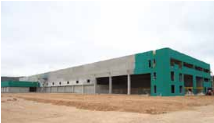
Estado actual de las obras en la planta de residuos.

de Valencia PREVALESA, S.A. El vial o carretera de acceso a la misma desde la carretera vieja de Peñíscola a Cáliz (a cargo de la empresa de Madrid TECONMA, S.A.) se