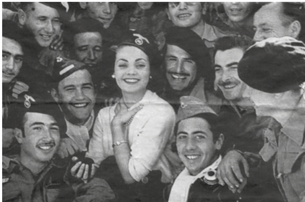
Carmen Sevilla en la seua visita a Sidi Ifni el Nadal de 1957.

Finalment, el 2 d'abril de 1958 se signaren els acords d'Angra de Cintra entre els governs espanyol i marroquí. Marroc recuperava tota la zona de Tarfaya (colònia