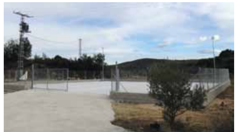
Obras de adecuación de espacios para el ecoparque municipal.

Durante los meses de febrero y marzo se ha llevado a cabo la construcción de un ecoparque municipal en el que los vecinos, de forma obligatoria, deberán trasladar todo tipo de enseres y utensilios domésticos en desuso: lavadoras, frigoríficos, colchones, muebles, televisores, fluorescentes, aceites, ropa, medicamentos, radiografías, baterías, etc.