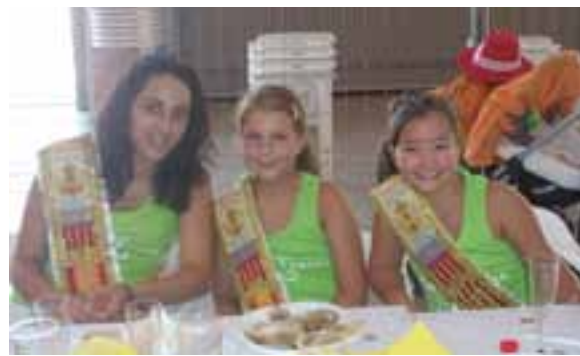
Otra vez nuestras Reinas de Fiestas