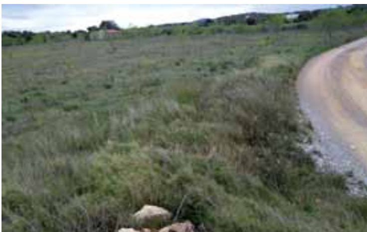
Finca rústica adquirida por la empresa para la ubicación del vertedero de rechazos.

Con todos los permisos medioambientales aprobados (Declaración de Impacto Ambiental y Autorización Ambiental Integrada a cargo de la Generalitat Valenciana), incluido el informe geológico favorable del Instituto Geológico Minero de España, el pasado 19 de enero el Ayuntamiento