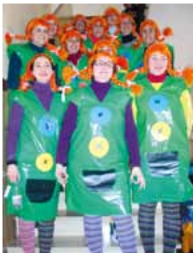
Carnaval escolar... para las mamás.