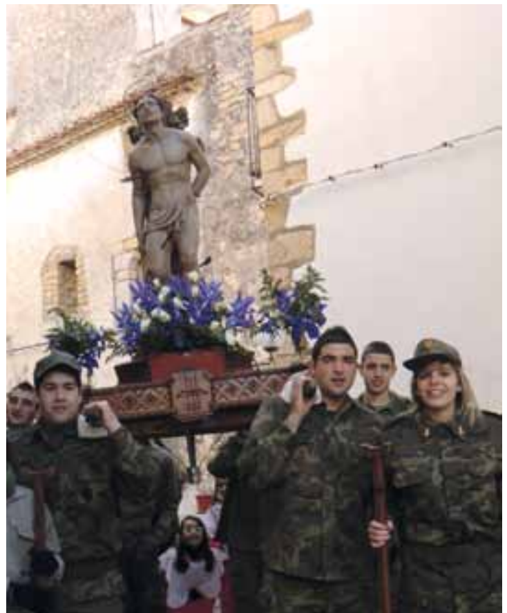
La imagen del Santo portada por los quintos.

las casas del municipio, bous de carrer y bou embolat por la tarde y verbena popular por la noche. Finalizaron los festejos el domingo con la ya tradicional baixada y pujada del Sant en procesión y Misa Mayor en la propia Ermita de Sant Sebastià.