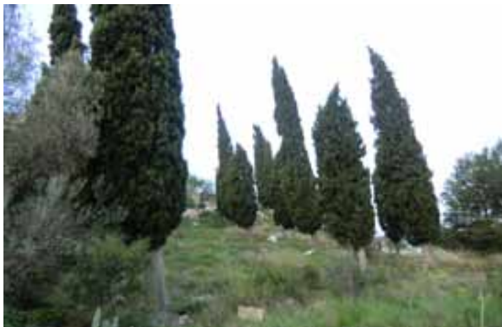
Zona del antiguo Calvari en la que se van a ejecutar las obras.

Los trabajos, que ascienden a 137.000 Euros (22.824.000 pts.), consisten en el desbroce y limpieza de toda la zona, construcción de aparcamientos en el espacio superior y confección de áreas ajardinadas y de esparcimiento (con