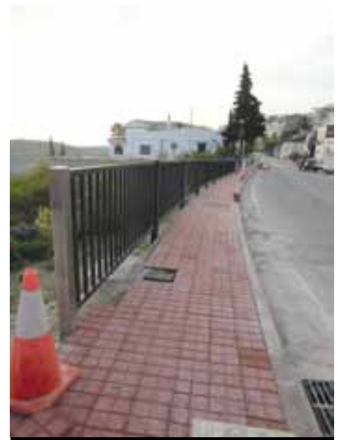
Acera del paseo, con su barandilla correspondiente.

Los trabajos se han dividido en dos fases: la primera a cargo de la mercantil PAVASAL, S.L. y la segunda adjudicada a la UTE OCIDE CONSTRUCCIONES, S.A. y EIFFAGE INFRA-