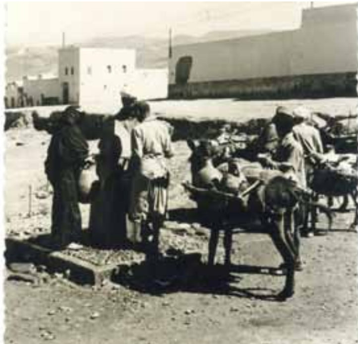
Soldats espanyols plenent els imprescindibles cànTERS d'aigüa per a proveïment de la tropa.

consumíem musclos i polps que nosaltres mateixa agafàvem als penya-segats de la costa. L'aigua dolça era sagrada, quasi més que el menjar. Els tres mesos que sortíem de la capital per a establir-nos en fortins destacats únicament ens donaven una cantimplora de litre, que era el consum per a cada soldat per a tot el dia.