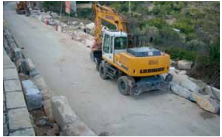
Trabajos de confección del muro lateral de contención.

y Hacienda (con cargo al Plan de Inversión Productiva en los municipios de la Comunidad Valenciana) y la otra por la Consellería de Infraestructuras, vía conservación de carreteras.