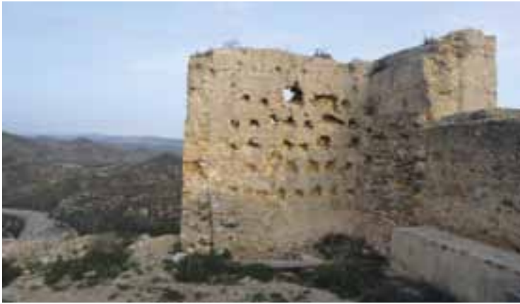
Zona en la que se centrarán parte de los trabajos actuales de restauración del castillo.

Como se recordará, las administraciones o instituciones inversoras, hasta la fecha, han sido las siguientes: