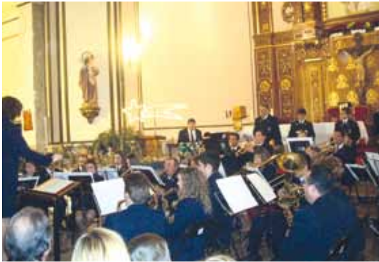
Concierto de navidad en la Iglesia Parroquial.

Unión Musical Santa Cecilia organizó el ya tradicional concierto navideño y, para la noche de fin de año, la cena de collón y posterior verbena hasta altas horas de la madrugada.