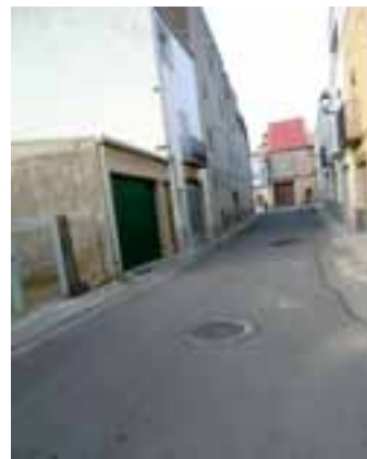
C/ Compositor Ferrer.

Las obras, a cargo de la empresa Entibaciones y Emisarios, S.L., han ascendido a un importe total de 42.418 Euros (7.069.383 Pts.), siendo sufragadas por la Diputación de Castellón y el propio Ayuntamiento (Planes Provinciales de Obras y Servicios de 2010).