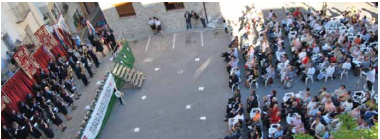
Una vista panorámica de la Plaça Maestrat con el público asistente y el escenario montado al efecto.