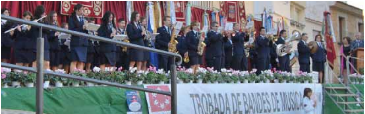
Actuación de la banda de Cervera.

Al pasacalle de rigor (desde las piscinas municipales), y previa recepción de autoridades en la Ermita de Sant Sebastià, le siguió la interpretación de un pasodoble por cada una de las bandas, imposición de corbatas a los estandartes, posterior interpretación conjunta del Himno regional, entrega de detalles y cena-aperitivo final en el Pabellón municipal.