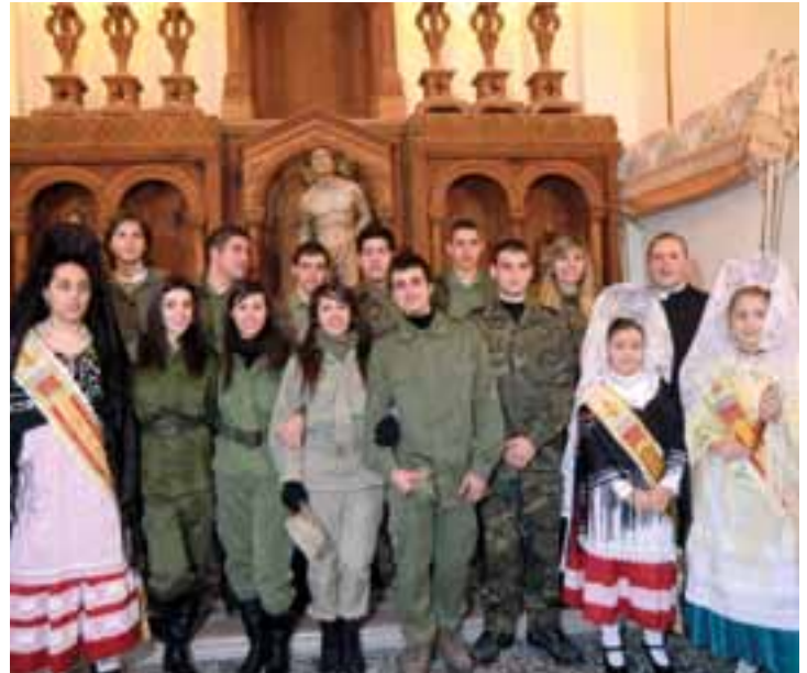
Quintos y Reinas ante la imagen de Sant Sebastià.

El pasado 22 y 23 de enero se celebró en la localidad la festividad de nuestro Patrón Sant Sebastià. Como viene siendo de costumbre, fueron los quintos/as del año, junto al Ayuntamiento, los encargados de organizar los diversos actos festivos. El sábado el tradicional recapte por