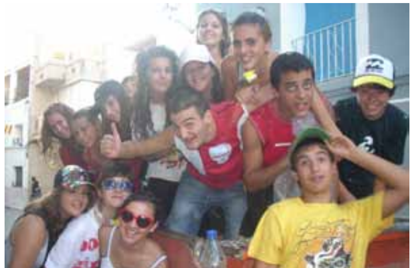
Colla de jovens en el desfile de carrozas