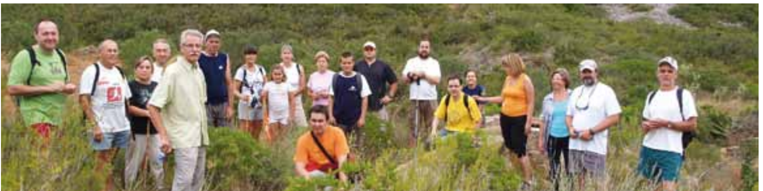
Participants de la marcha senderista en el Pou de la Perdiguera.