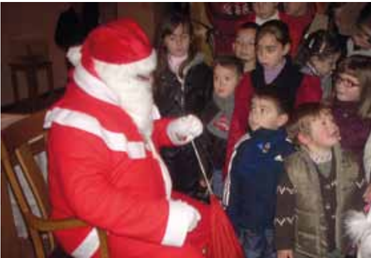
Papa Noel reparte caramelos a los más jóvenes del municipio.

Unión Musical Santa Cecilia organizó el ya tradicional concierto navideño y, para la noche de fin de año, la cena de collón y posterior verbena hasta altas horas de la madrugada.