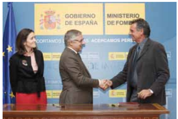
La Ministra de Cultura, el Ministro de Fomento y el Alcalde de Cervera en la firma del Convenio de una nueva fase de Restauración de las murallas del castillo. Madrid, septiembre de 2010.