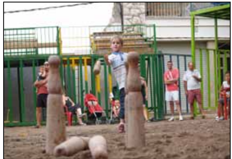
Participantes en el último concurso de birles celebrado en la Plaça Maestrat.

Les partides es desenvoluparen a partir de les cinc de la tarda a la plaça Maestrat, entre el dijous i el diumenge, excepte les partides de desempat que es van celebrar a zona de joc de birles i petanca (baix les cases). Quan a la normativa de joc, es basa en part de les normes de competició federativa catalana actual i la tradició local, excepte per als xiquets, als quals s'ha aplicat una regla