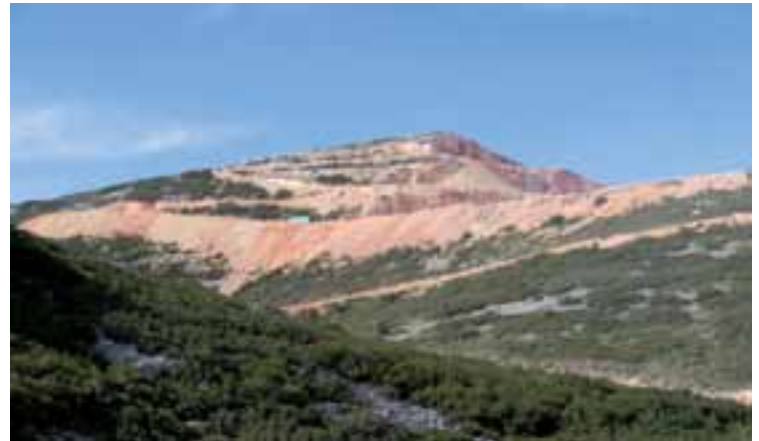
Paraje de la Perdiguera en la que se están extrayendo loa áridos.

dos Cribados Domingo, S.A.), se ha notificado a la citada empresa el cierre de la actividad de extracción de áridos que se viene llevando a cabo en varias parcelas del monte La Perdiguera. Las razones que alega el Ayuntamiento no son otras que la imposibilidad de conceder la preceptiva