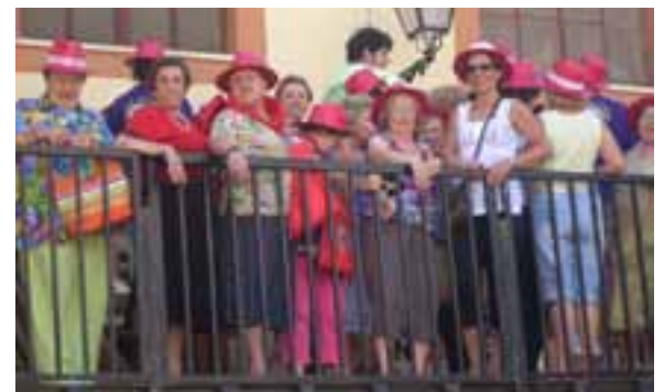
Mirant la becerrà... des del carafal