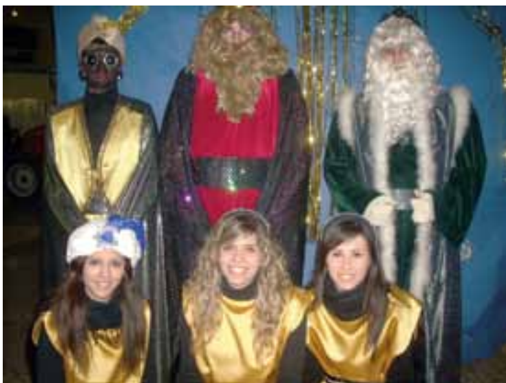
Sus Majestades los Reyes Magos de Oriente, con sus correspondientes Pajes.

Los talleres de manualidades para los más jóvenes (organizados los días 27 y 28), el cada vez más concurrido concurso de belenes y la llegada de los Reyes Magos de Oriente la noche del 5 de enero pusieron punto final a tan entrañables fiestas.