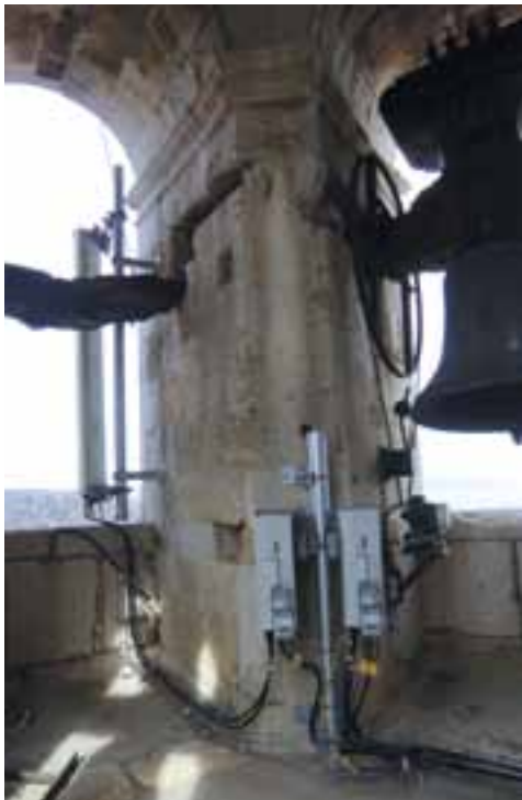
Instalación de antena y receptores para telefonía móvil.

El 23 de diciembre el Alcalde del municipio y la Compañía VODAFONE ESPAÑA firmaron un Convenio de colaboración (con una vigencia de 10 años, prorrogables por mutuo acuerdo de las partes por 3 períodos sucesivos de 5 años) con objeto de dotar a la población de una red de comunicación de calidad consistente no sólo en el adecuado despliegue de la red de telefonía móvil, sino también la posibilidad de utilizar esta infraestructura técnica para el posterior desarrollo y utilización de una avanzada tecnología de la información y conocimiento para todo el vecindario.