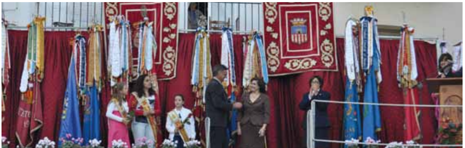
El Alcalde, la Presidenta de la Unión Musical y la Directora de la banda en el acto de imposición de insignias y corbatas.